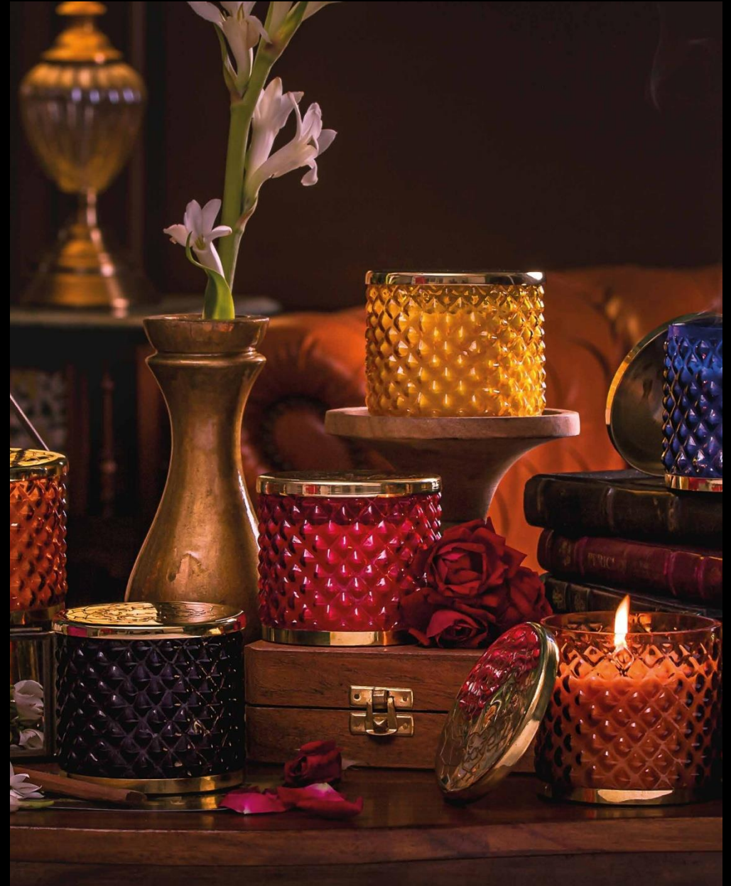
Scented Candles | 240g