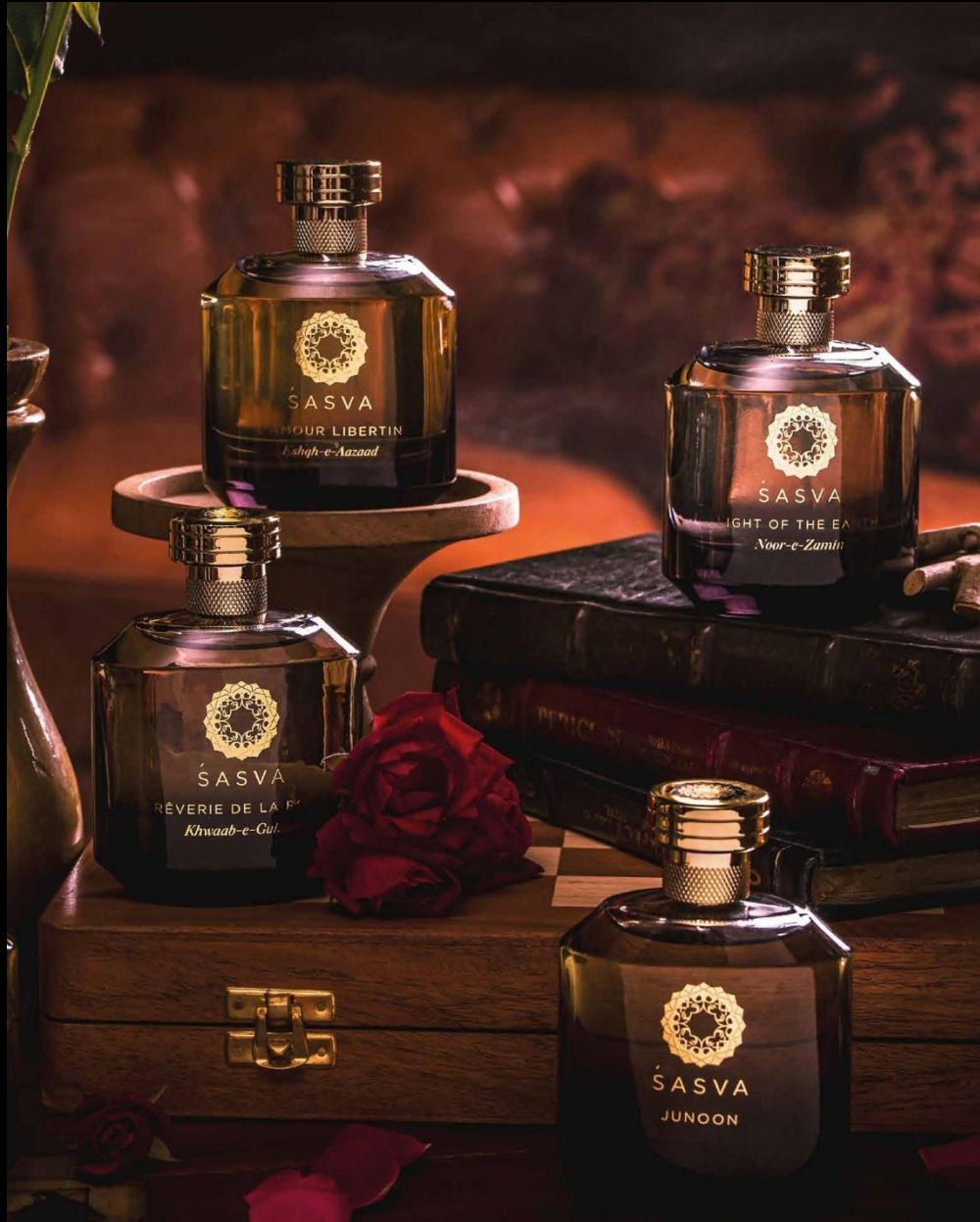
Perfumes | 20ml & 100ml